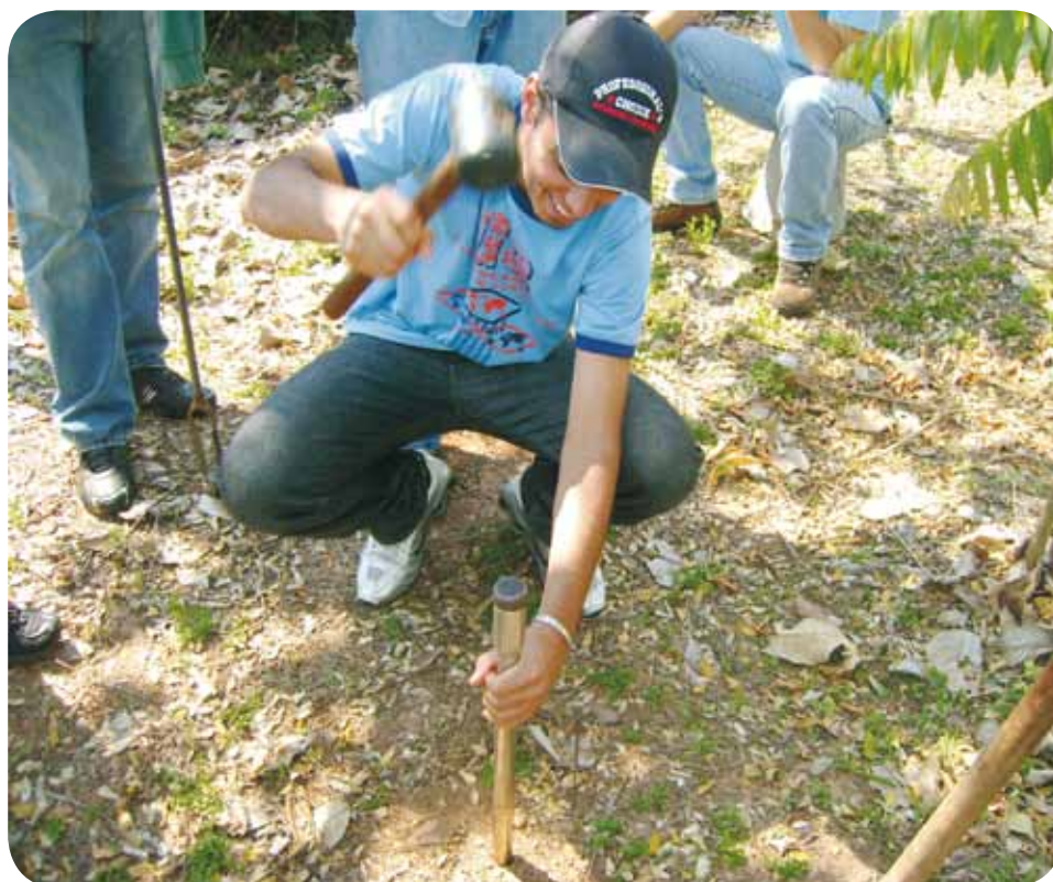
Aula prática realizada no Campus II da FAI - amostragem de solo utilizando a sonda terra.

↳ Após obtida a amostra composta, retirar cerca de 300g de solo em uma caixinha de papelão própria para ser encaminhada ao laboratório, identificando-a com o nome da propriedade,