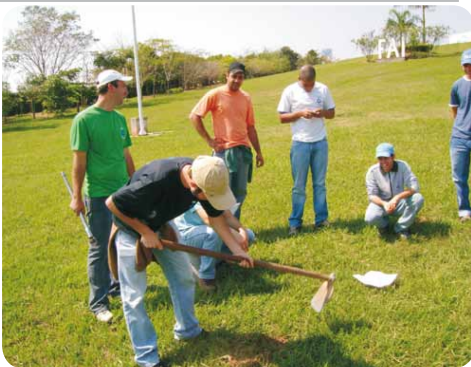
Aula prática realizada no Campus II da FAI – alunos são incentivados a utilizar os equipamentos disponíveis na propriedade agrícola.

A amostragem de solo deve ser realizada com alguns meses de antecedência ao plantio para que, mediante o