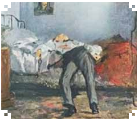
Quadro de Edouard Manet (1877): O suicídio